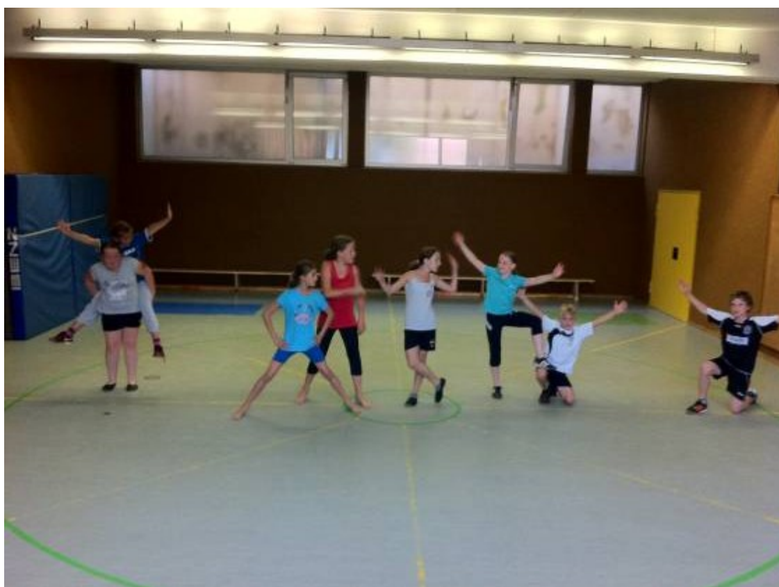
Vorbereitung auf das Stadtfest Heubach